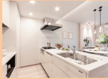
※写真はモデルルームを2022年4月に撮影。