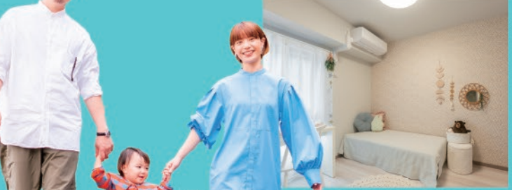
※写真はモデルルームを2022年4月に撮影。

家賃がもたないで購入。街中のゴミゴミした場所から静かで海が見える環境を選びました！