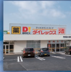
※周辺環境写真は2021年11月に撮影。

ダイレックス隣接 マンションのすぐ横にダイレックスがあり、毎日の仕事帰りにさっと寄れて便利。